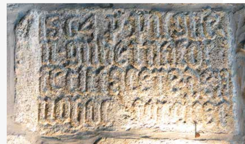
Piliers de la nef de la chapelle Saint Fiacre à Plouider / inscription en vieux latin : P. Pilgwen Gubernator Fecit. Facere. de. Nuolvo/hos Fornices 1564. P. Pilgwen, gouverneur, a fait refaire ces voûtes. La famille de Pilgwen vivait au manoir de Kerorlou.

LES ARTISTES ASSURENT DES PERMANENCES DE LEURS EXPOSITIONS, TOUTES LES DATES SONT DISPONIBLES SUR NOTRE PAGE FACEBOOK.